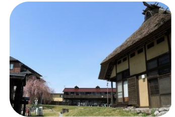
三春の里田園生活館